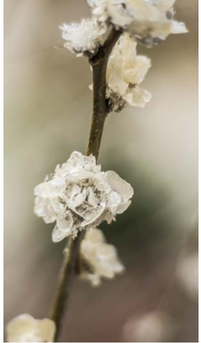
À droite : Vue de l'exposition « Qui sait combien de fleurs ont dû tomber » (détail), Musée Gadagne, Lyon, 2019, mûrier, peaux mortes. Photo : Pauline Roset © Adagp, Paris 2021