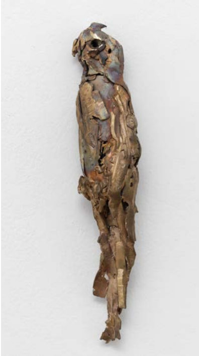
À gauche : Lionel Sabatté , Fragment du 11 mars 2020 , 2020, bronze, tirage unique, 128 x 76 x 41 cm, courtesy de l'artiste.